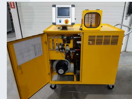
Banc tests soupapes