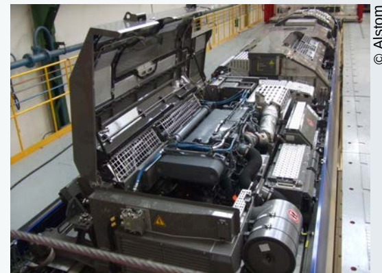
Connectique et PDR pour Power Pack